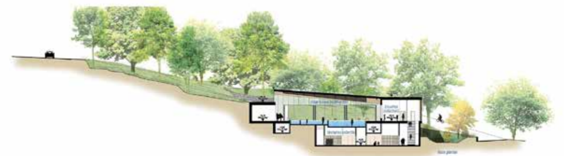
Plan de coupe du nouveau complexe.