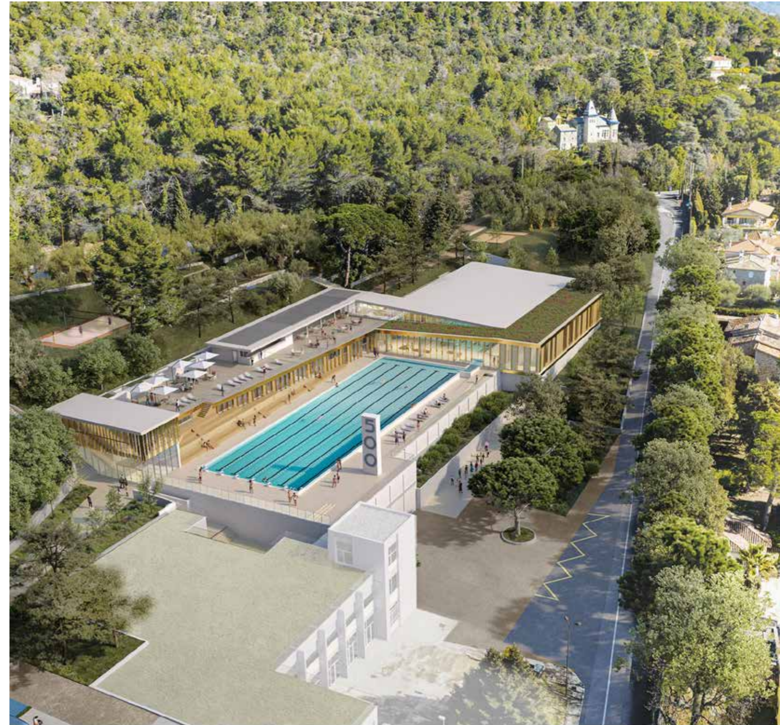
Perspective aérienne du nouveau complexe.