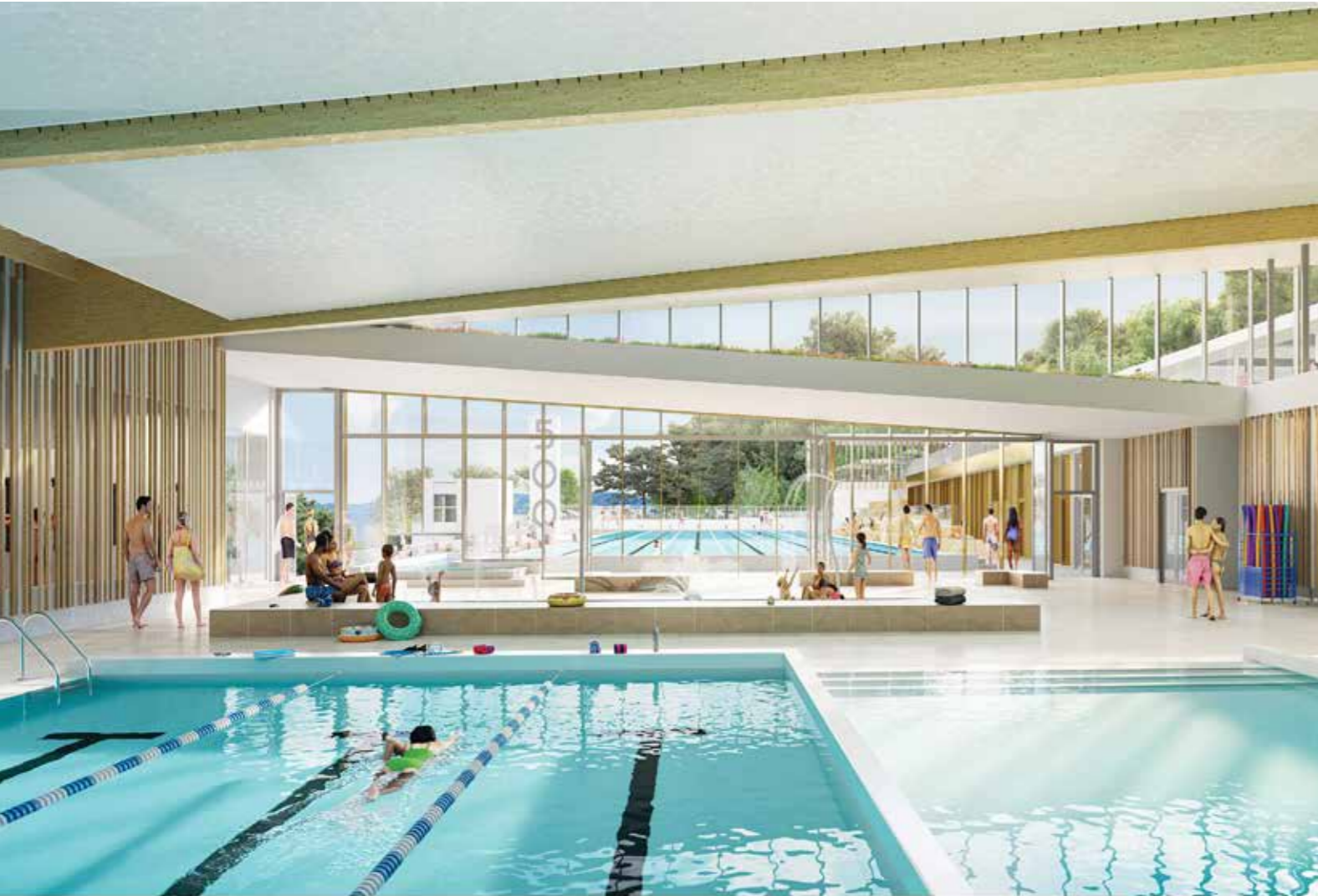
Perspective intérieure du bassin multifonction couvert.

>Un bassin nordique de 50m x 15m (6 couloirs) avec chenal d'accès depuis le hall bassins. Profondeur entre 135cm et 250cm.