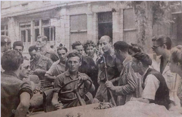
24 août 1944, les Grassois accueillent les soldats de la First Special Service